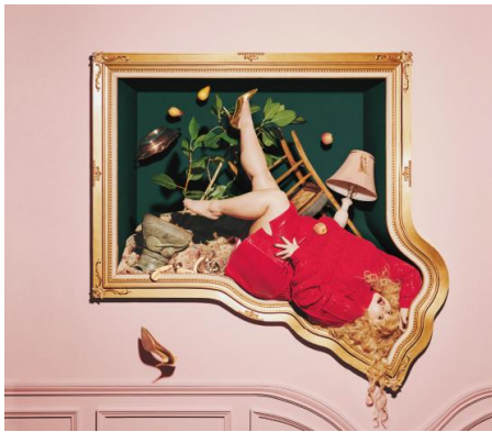
女の子の感性をファッションで表現する “渡辺直美”プロデュースブランド 「プニユズ」

女の子の感性をファッションで表現する“渡辺直美”プロデュースのブランド「プニユズ」や、スウェーデン発の足元からHAPPYになれるレッグウェアブランド「ハッピーソックス」、人気のスイーツや話題の雑貨を期間限定で展開していく、食と雑貨のストア「ポップアップ ナウ」など、お買い物楽しくなるような注目のNewショップが続々オープンいたします。