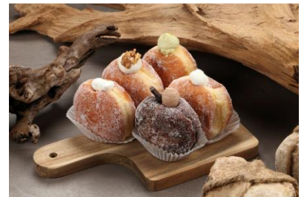
ピージードーナツ

ライフステージが変わりゆく大人の女性たちが自信を持ってファッションを楽しめる、シンプルなかにも程よい時代感と女性らしさを感じるアイテムやコンテンツを展開するブランド！