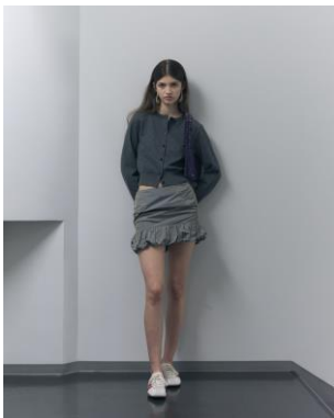
アティセクション

ルクア大阪ホームページよりご確認くださいませ。(2月21日(金)情報公開) https://www.lucua.jp/